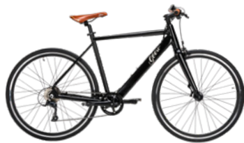
Vintage Vinyl Black (Schwarz)