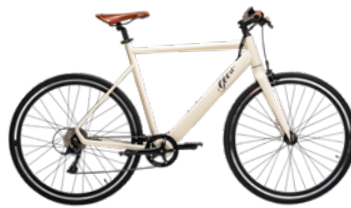
Cream Soda Beige