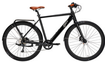
Vintage Vinyl Black (Schwarz)